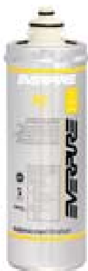
AC Filterpatron Art. Nr: 9601-12

Ger förträffligt vatten för kalla drycker